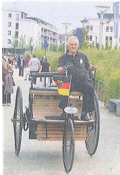
Wohl der älteste Vertreter der Gattung Automobil: die Motorkutsche, hier unterwegs Richtung Seemaxx.